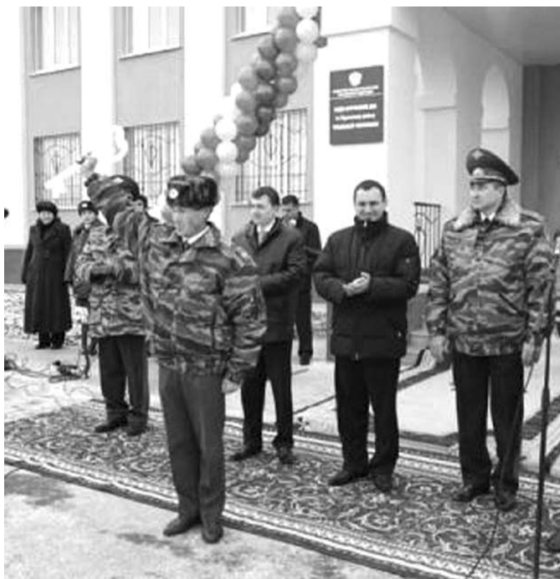
На фото впереди - Буратино с золотым ключом от 3-этажного здания из 4-х возможных. На заднем фоне два закадычных друга - экс-президент ЧР Федоров и начальник МВД Антонов. Не они-ли приложили руку к исчезновению этажа?

г. Ядрин Чувашской Республики (местонахождение объекта)